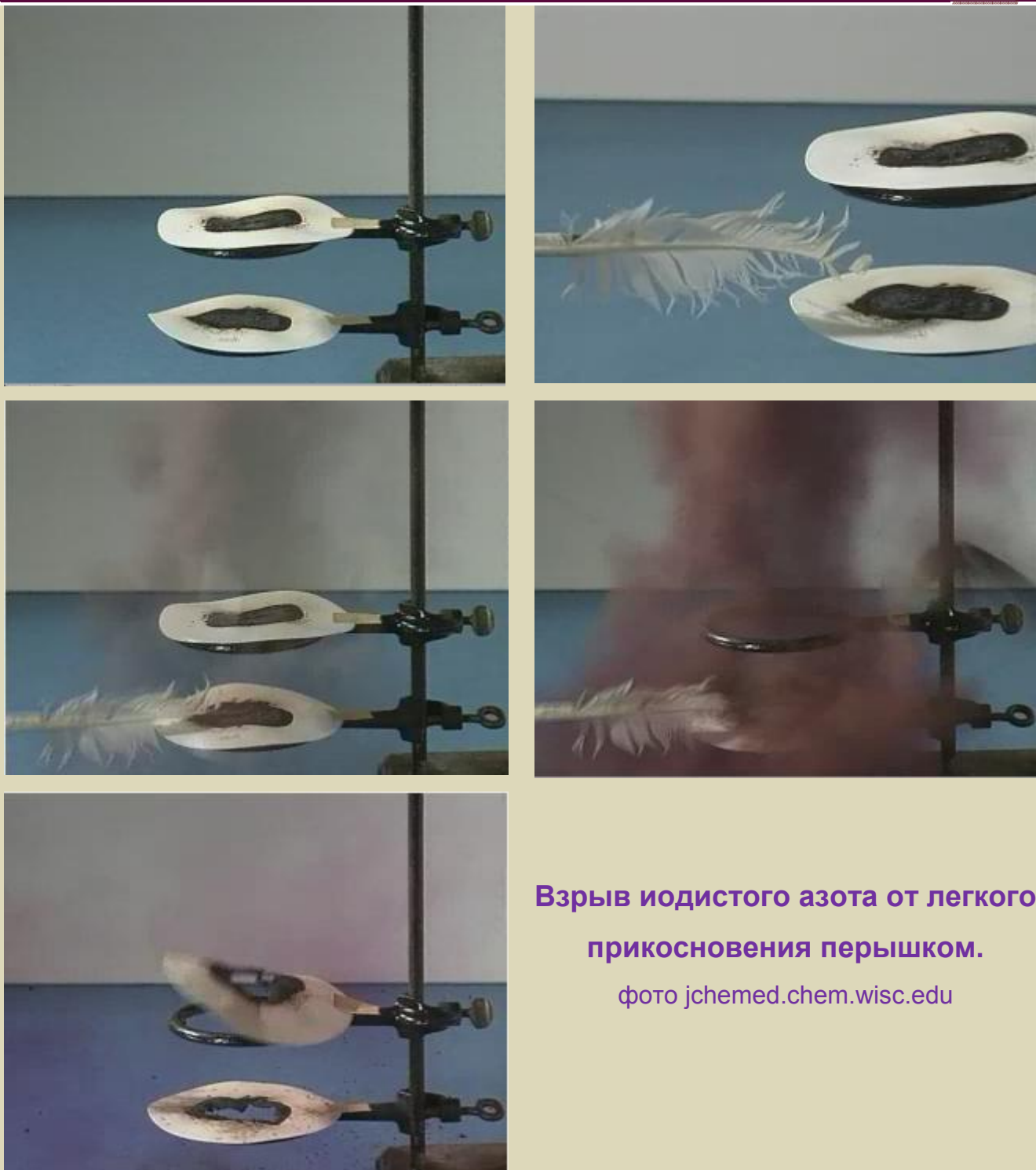
Взрыв иодистого азота от легкого прикосновения перышком.